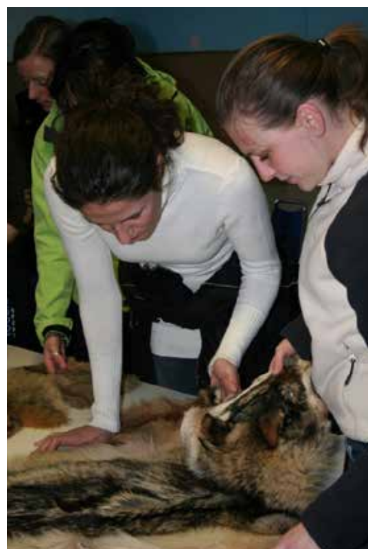
Študenti biologije med pripravami na delavnico o velikih zvereh.

Za učitelje biologije smo organizirali seminar o volkovih, kjer so imeli priložnost spoznati in se podučiti o šolskih aktivnostih, ki jih je predlagala projektne skupina. Razpravljali so o didaktični vrednosti izobraževalnega materiala , ki smo ga pripravili za šolske aktivnosti in so ga ob zaključku seminarja tudi prejeli. Paket so sestavljali: priročnik za učitelja, delovni listi za učence in rešitve nalog, PowerPoint predstavitev o volkovih, izobraževalni film ter projektne poster. Ves material so prejeli tudi v elektronski verziji na USB ključkih. Dodatno smo organizirali tudi delavnice za srednješolce , na katerih je sodelovalo približno 400 srednješolcev. Ocenili so pripravljen izobraževalni material in izpolnili vprašalnik o poznavanju in odnosu do velikih zveri Slovenije. Januarja 2014 je bil SloWolf izobraževalni material predstavljen tudi na izobraževalni konferenci, ki jo je organizirala Pedagoška fakulteta Univerze v Ljubljani.