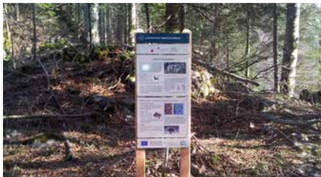
Informacijska tabla o volkovih v Sloveniji in projektu je bila postavljena na učni poti na Mašunu (priljubljena turistična destinacija na območju volka v Dinaridih).

[ob fotografiji] Na učni poti na Mašunu, priljubljene turistične točke na območju prisotnosti volkov v Dinaridih, smo postavili izobraževalno tablo o volkovih v Sloveniji in o SloWolf projektu.