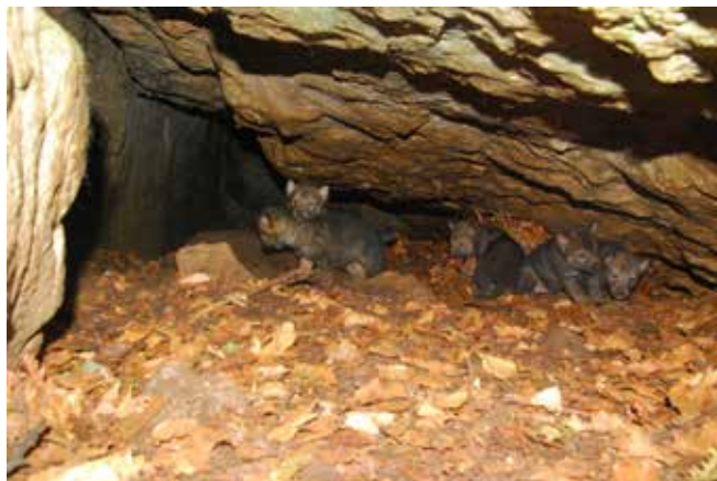
Najdeni mladiči volkulje, ki je bila v okviru projekta opremljena s telemetrično ovratnico

znanstveno podprtih dejstvih. Tak način spremljanja populacije je pristojno ministrstvo pričelo uporabljati že tekom projekta in se bo nadaljevalo tudi po njegovem zaključku.