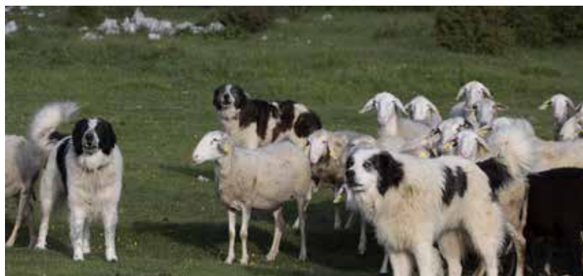
Donirani pastirski psi s svojo čredo.

O uporabi električnih ograj in pastirskih psov za preprečevanje škod smo izdelali dve brošuri, ki smo ju razdelili rejcem, kmetijskim pospeševalcem in lovcem na projektnem območju. Izvedli smo tudi pet delavnic za rejce na katerih smo jim predstavili dobre prakse vzgoje in skrbi za pastirske pse ter pravilno uporabo prenosnih električnih mrež za nočno zapiranje drobnice.