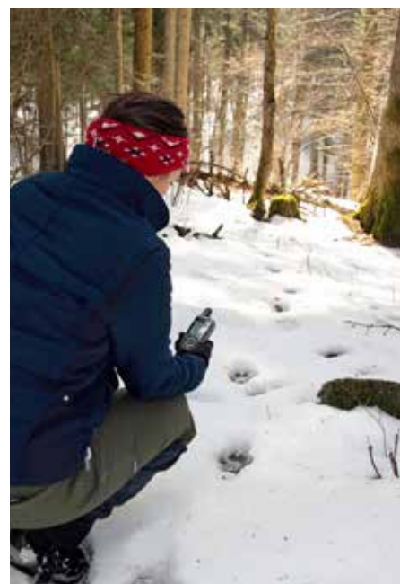
Wolf snow tracking