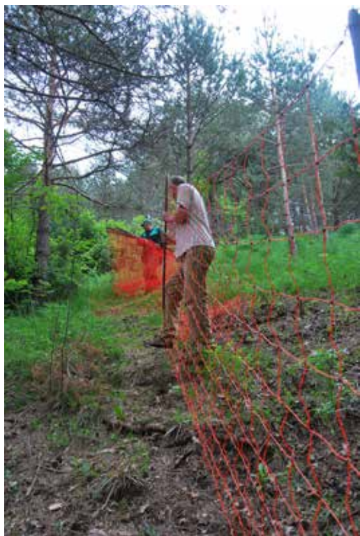
Postavljanje doniranih visokih elektro ograj.

Škode, ki jih volkovi povzročajo na drobnici za njihovo ohranjanje, tako v Sloveniji kot drugod po Evropi in svetu, predstavljajo največji izziv. V sklopu demonstracije primerov dobrih praks smo osmim rejcem drobnice, ki imajo od 30 do 800 ovac, v preteklosti pa so imeli dokumentirane škode po volkovih, donirali visoke električne mreže/ograje in pastirske pse. Že po prvih dveh letih uporabe podarjenih zaščitnih sredstev, se je izplačilo odškodnin tem rejcem zmanjšalo za skoraj 200.000 €, kar znaša skoraj toliko kot celoten prispevek Slovenije k financiranju SloWolf projekta. Ključ do uspeha je bila prav gotovo pravilna in doselna uporaba podarjenih zaščitnih sredstev.