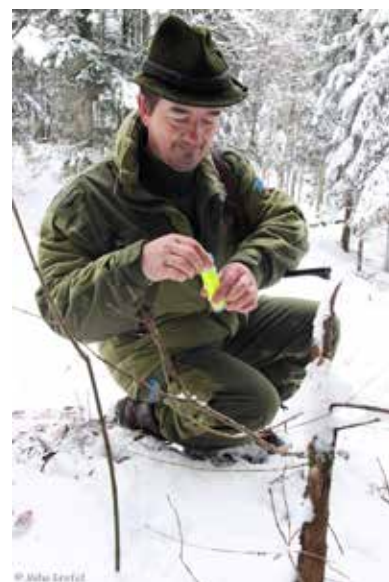
Lovci in ostali prostovoljci so sodelovali v projektne zimskem sledenju.

K zimskim sledenjem, poletnim izzivanjem oglašanja volkov in k zbiranju njihovih neinvazivnih genetskih vzorcev smo za ozaveščanje in boljše sprejemanje volkov povabili lovce in druge prostovoljce . Njihova pomoč pa nam je omogočila tudi pokrivanje razmeroma velikega projektnega območja na terenu, ki bi samo z delom zaposlenih strokovnjakov sicer predstavljal precejšen finančni zalogaj. V času projekta so prostovoljci pri spremljanju populacije vse skupaj sodelovali 2429-krat: na seznam za obveščanje o aktivnostih pri katerih lahko sodelujejo prostovoljci se je vključilo 984 ljudi, 891 se jih je udeležilo izobraževalnih predavanj, 453-krat so sodelovali v zimskih sledenjih in 245-krat pri izzivanju oglašanja. Poleg tega smo k sodelovanju pri zbiranju neinvazivnih genetskih vzorcev povabili tudi 108 lovskih družin, ki imajo skupaj preko 5000 članov. Poletna izzivanja oglašanja volkov so bila izvedena v treh zaporednih letih in ob tako številčnem vključevanju prostovoljcev smo lahko v enem dnevu dela na terenu pokrili 3384 km 2 . Enako smo v zimskem času tekom treh let organizirali 65 sledenj, na katerih smo za volčjimi sledmi pregledali 2230 km gozdnih cest. Volkove smo sledili na 171 km in na sledih zbrali 185 genetskih vzorcev. Velik interes in samo število vključenih prostovoljcev je presegel vsa naša pričakovanja.